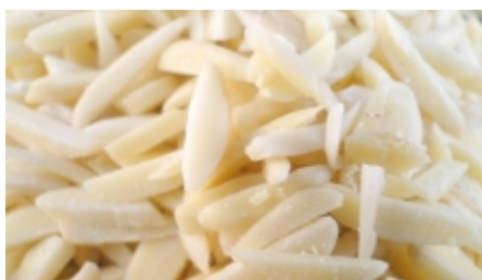
Amãndoa palito (fatiada) R$ 95,00

Amendoa chilena laminada. Embalagem de 1kg Envio em atã© 48 hs [Detalhes do Produto...]