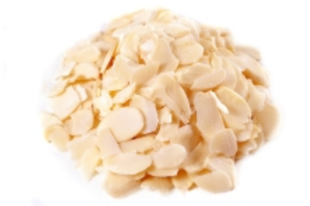
Amãndoa laminada R$ 85,00

Embalagem de 1kg Envio em atã© 48 hs. [Detalhes do Produto...]