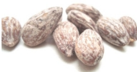
Amãndoa torrada e salgada R$ 80,00

Amãndoa palito chilena. Embalagem de 1kg. Envio em atã© 48 hs [Detalhes do Produto...]